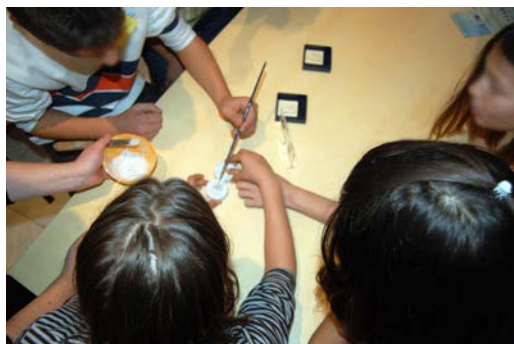
Εικόνα 5. Οι μαθητές δημιουργούν με καλούπι γύψινα αντίγραφα αρχαίων νομισμάτων.