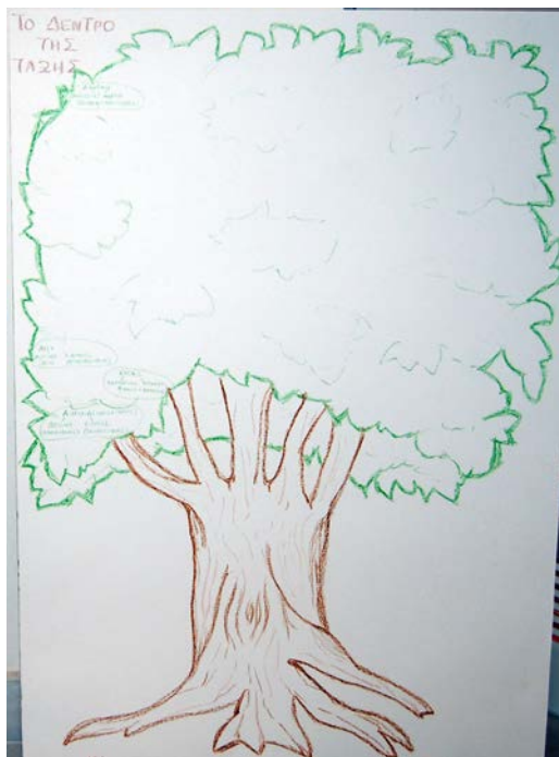
Εικόνα 4. Το δέντρο των μαθητών της τάξης.