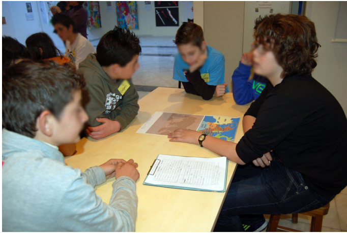
Εικόνα 2. Οι μαθητές εντοπίζουν σε χάρτη τις πόλεις-κράτη της αρχαιότητας.

Ακολουθως, δόθηκαν στα παιδιά χάρτες του αρχαίου ελληνικού κόσμου, όπου είχαν επισημανθεί οι σημαντικότερες πόλεις – κράτη της αρχαιότητας, που παράλληλα συνιστούσαν τον τόπο καταγωγής των κατοίκων της αρχαίας πόλης. Τους ζητήθηκε να προσπαθήσουν να εντοπίσουν όσες από αυτές είχαν ήδη σημειώσει κατά τη διαδικασία «απογραφής» των κατοίκων μέσω των επιτύμβιων στηλών και στη συνέχεια να ελέγξουν, σε σύγχρονους πλέον χάρτες, σε ποια σημερινά κράτη αυτές βρίσκονται και να κάνουν πιθανές συγκρίσεις. Στη διαδικασία αυτή ανταποκρίθηκαν. Στη συνέχεια, με βάση τα αρχαία νομισματοκοπεία που είχαν εντοπίσει τα παιδιά στην έκθεση, επιχείρησαν να κατασκευάσουν τα ίδια με γύψο αντίγραφα των αρχαίων νομισμάτων που είχαν ήδη δει, μέσα σε ειδικά καλούπια που κατασκευάστηκαν για το σκοπό αυτό από το Μουσείο, τα οποία πήραν μαζί τους σαν αναμνηστικό της επίσκεψης. Με αφορμή τα αντίγραφα των αρχαίων νομισμάτων ζητήθηκε, τέλος, από τα παιδιά να συμπληρώσουν στο «Δέντρο της τάξης» τους πιθανά χαρακτηριστικά αντικείμενα που ο καθένας θα μπορούσε να είχε φέρει από την ιδιαίτερη του πατρίδα, ενδεικτικά της καταγωγής του.