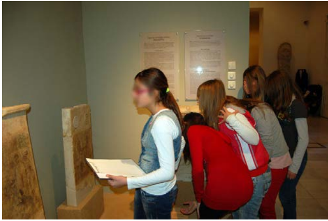
Εικόνα 1. Οι μαθήτριες μέσα στο Αρχαιολογικό μουσείο Βόλου αναζητούν πληροφορίες από τις επιτύμβιες στήλες της αρχαίας Δημητριάδας.